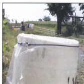
LA CHIUSURA ERMETICA DI UN SELO O BUCONE D'ACQUA, COME NELLA FOTO, IMPEDISCE LO SVILUPPO DI ALCUNE MIGLIAIA DI ZANZARE PER OGNI SETTIMANA

USA CON PARSIMONIA L'ACQUA PER SCOPI IRRIGUI;